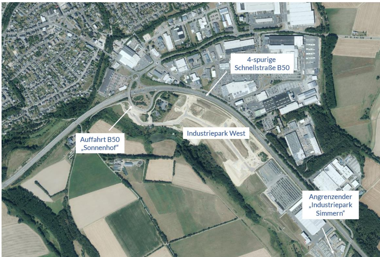
Luftbild Industriepark West