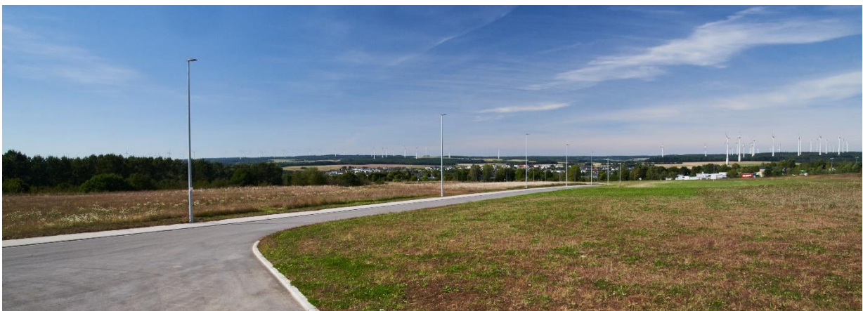
Industriepark West

Der Industriepark West befindet sich im Südosten der Stadt Simmern/Hunsrück, direkt an der 4-spurig ausgebauten Schnellstraße B50. Dort grenzt er an den Industriepark Simmern. Durch diese ausgezeichnete Lage ist er von der B50 aus gut einsehbar, sodass vor allem die vorderliegenden Grundstücke eine große Werbewirkung erzielen. Die kreuzungsfreie Zufahrt erfolgt von der B50 kommend über die Abfahrt „Sonnenhof“. Die Anschlussstelle zur Bundesautobahn A61 kann binnen 8 Minuten erreicht werden. Der Flughafen Frankfurt-Hahn ist in 15 Minuten erreichbar. Die Verkehrsanbindung in Richtung Benelux ist durch den neuen Hochmoselübergang ebenfalls hervorragend. Das Zentrum der Stadt Simmern/Hunsrück befindet sich ca. 5 Fahrminuten von dem Industriepark West entfernt.